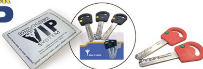
Ключі користувача Монтажні ключі

Система MUL-T-LOCK® Modular дає змогу збирати циліндри необхідного розміру та симетрії, дозволяє побудувати будь-яку сторону циліндру від мінімум 31 мм до 80 мм з шагом 5 мм від базового розміру 31,33 або 35 мм.